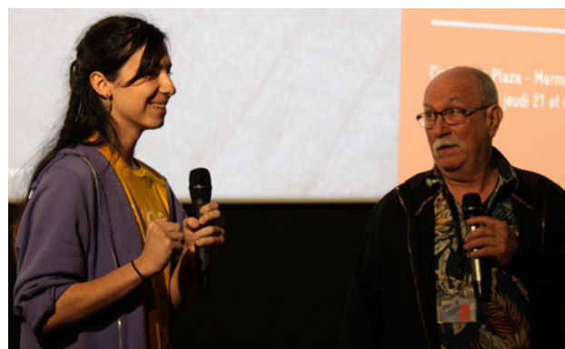
Présentation de films étudiants - Rencontres Documentaire et Animation