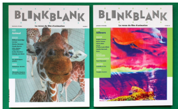
Couverture des numéros 9 et 10 de la revue Blink Blank, parus en 2024

La revue bénéficie également des dispositifs d'Aide aux Revues de la Région Pays de la Loire , du CNC et du Centre National du Livre (CNL) .