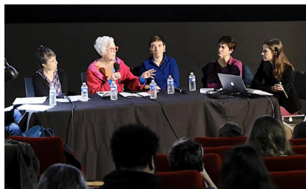
« Ecrire et réaliser son court métrage d'animation » - Les Animés, 2024