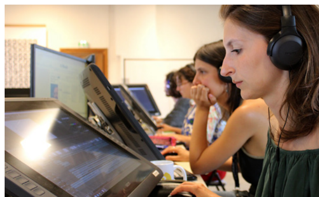
Résidence « Première Page » 2024 © ALN