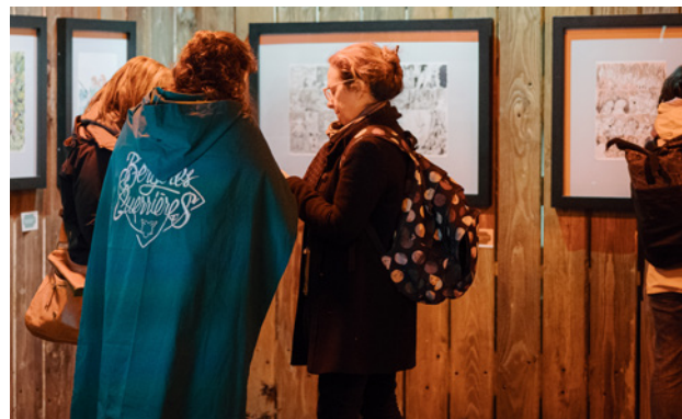
Exposition Bergères Guerrières au LU - ExtrAnimation#7