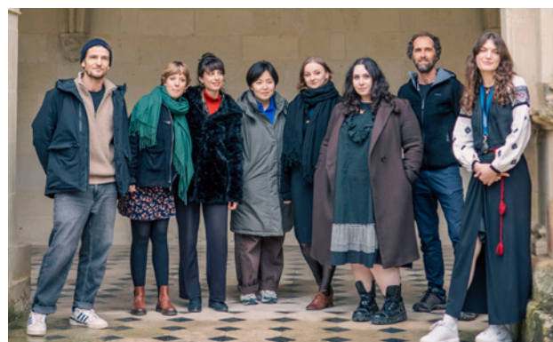
Résidents au mois d'octobre 2024 - photo de groupe