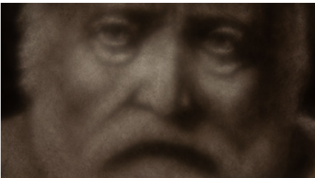
© Charles Nogier : Voir le soleil se lever dans la lune