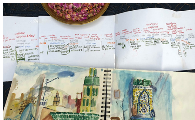
Table de travail de Emma Zwickert en résidence à Meknès, 2024