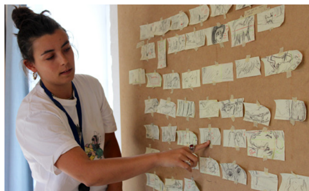
Résidence « Première Page » 2024 © ALN