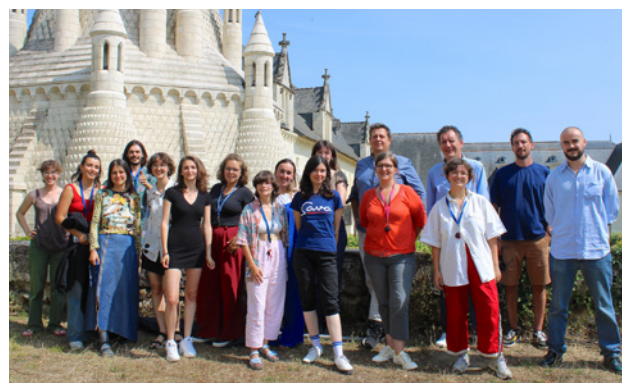
Résidence « Première Page » 2024