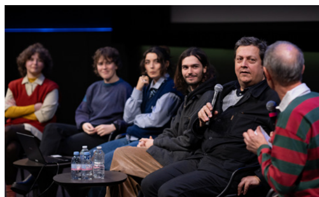
Séance « Première Page » au Forum des Images