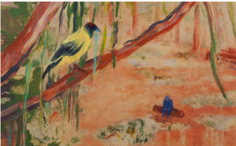
© Fabienne Wagenaar : Plus douce est la nuit