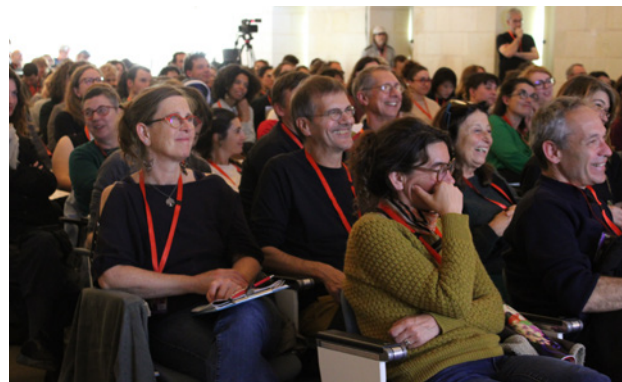
Public des Chemins de la création 2024