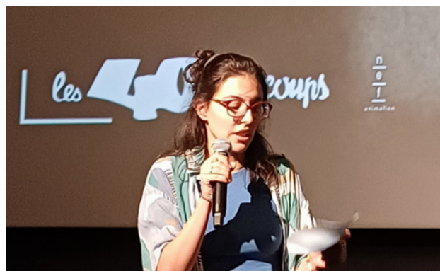
Présentation de la séance Talents en région - Estival Premiers Plans