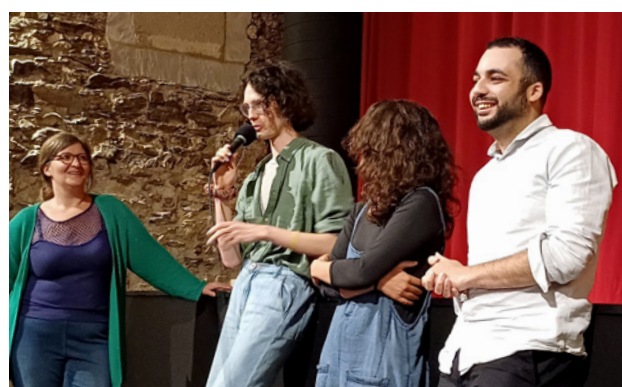
Séance « Première Page » au Cinématographe à Nantes

A noter : les 11 films ont également été diffusés lors des rencontres Les Chemins de la Création , et lors du Festival ExtrAnimation .