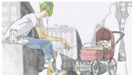
© Samuel Patthey : Sans voix