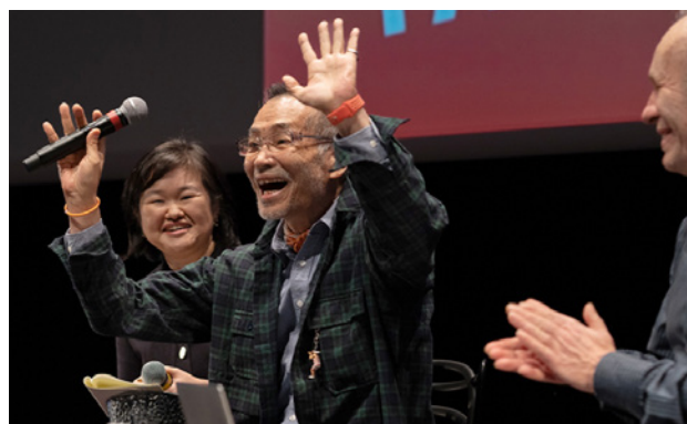
Masterclass de Rintaro, février 2024

A noter : deux projets reçus en résidence étaient sélectionnés pour les pitches lors du festival : De la carcasse à l'extase de Cerise Lopez (en résidence en 2019) et Fil d'errance de Boris Labbé (en résidence en 2021).