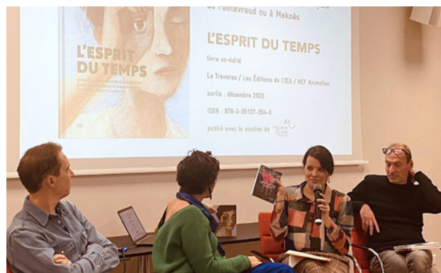
Présentation des activités sur le territoire, janvier 2024