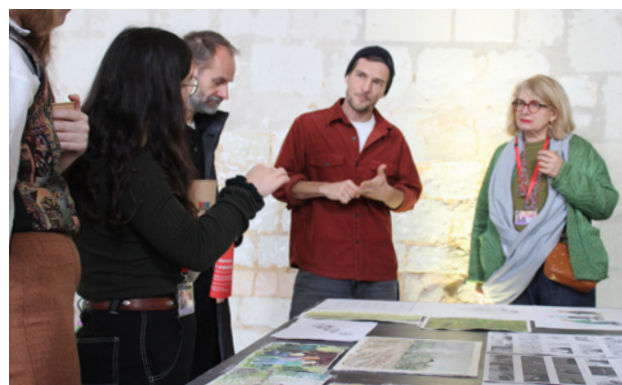
Rencontre avec les résidents - Les Chemins de la création 2024