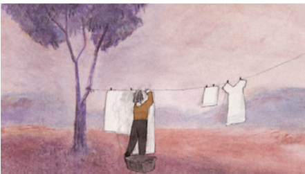
© Maria Trigo Teixeira : It Shouldn't Rain Tomorrow