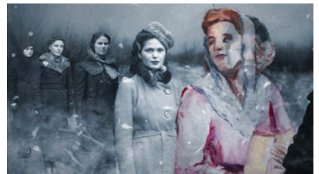
© M. Boulissière et B. Stamatini : Quelque chose de divin