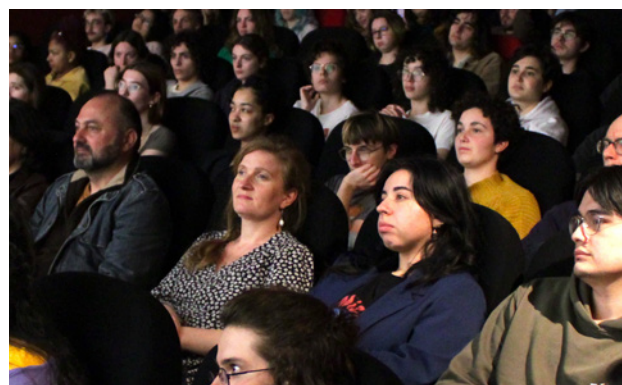
Public des Rencontres Documentaire et Animation 2024