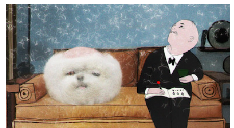
© Eleonore Geissler : That mystery of mysteries