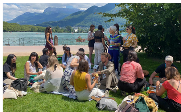
Pique-nique d'anciens résidents NEF Animation, au bord du lac d'Annecy