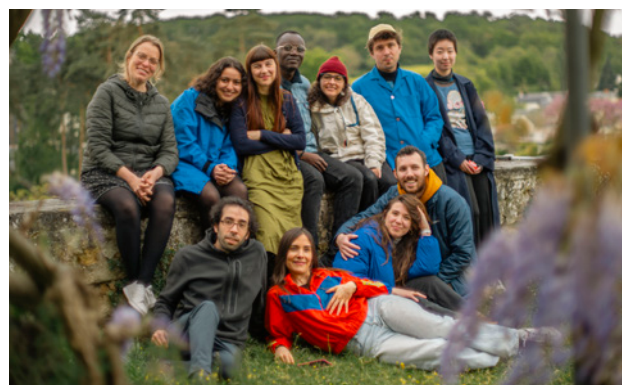
Résidents au mois d'avril 2024 - photo de groupe