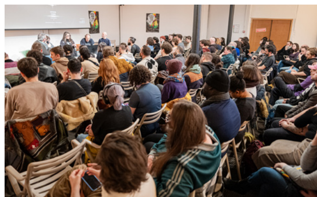
Table ronde 'jouée' Elden Ring - ExtrAnimation#7