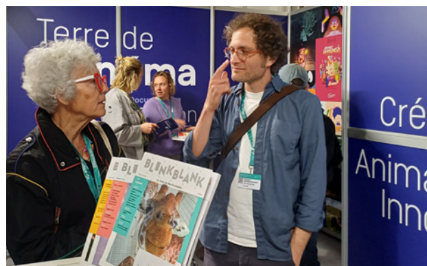
Stand des Pays de la Loire, au MIFA 2024

Il y avait cette année une forte représentation des artistes soutenus par la NEF Animation au Festival avec 8 films écrits en résidence à l' Abbaye royale de Fontevraud en compétition officielle et 2 projets soutenus en résidence sélectionnés pour les pitches du MIFA. 4 récompenses ont été reçues au total par des films de résidents dont le Prix du Public pour Hurikán et le Prix Alexeïeff-Parker pour Beautiful Men de Nicolas Keppens.