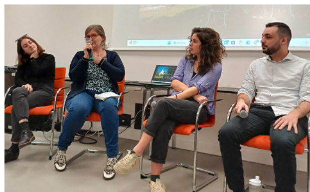
Focus « Première Page » à Premiers Plans, janvier 2024

Comme chaque année, la NEF Animation attribue également le prix « Plans Animés » qui offre au lauréat une invitation en résidence à Fontevraud.