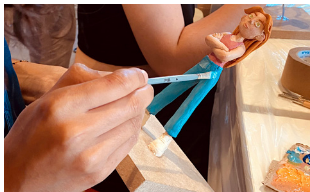
Grand Atelier avec Claude Barras, 2024

Programme/flyer accessible en ligne : ici