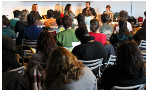
Table ronde « Nouveaux imaginaires de l'animation »