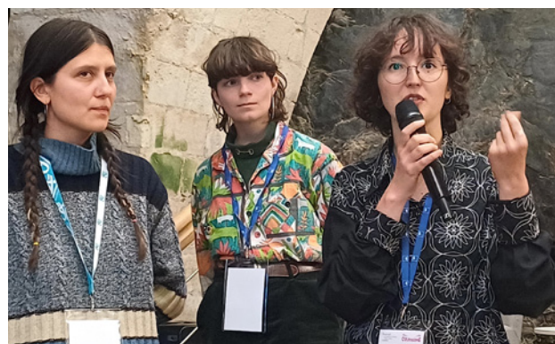
Trois réalisatrices de Première Page au Festival Cultissime à Angers