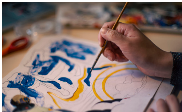
Cassie Shao en résidence, avril 2024