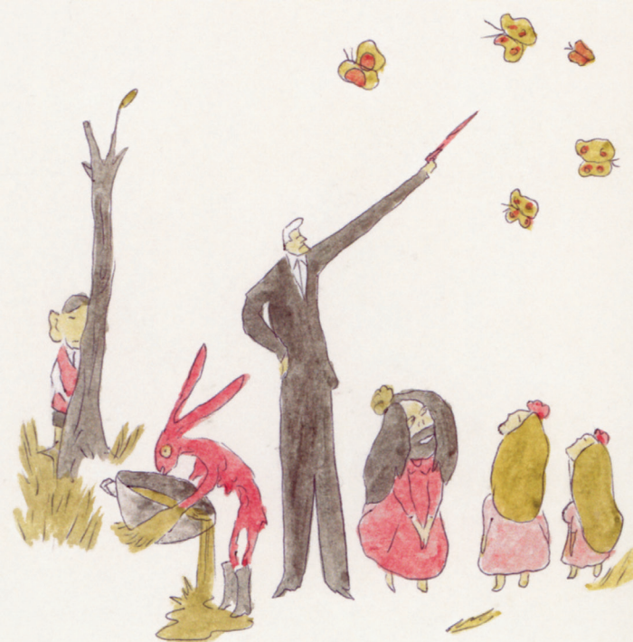
Bertrand Mandico, illustration pour Fleur de sel, Éditions Cornélius, 2012