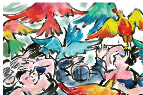
Peinture préparatoire pour le film La Traversée © Florence Mialhe

Accessible gratuitement, du 4 au 14 novembre inclus, de 14h à 18h, sauf le lundi 8 novembre. Pendant ExtrAnimation (12 et 13 novembre), accessible de 11h-19h.