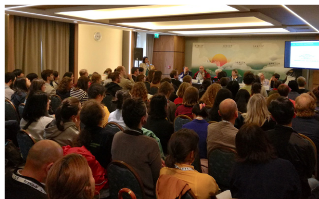
Présentation du collectif de résidences à Annecy