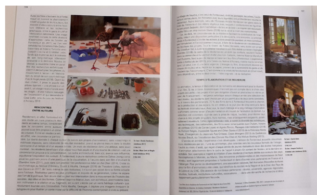
Numéro spécial Cinéma d'Animation - Art Press 2 - mars 2019

Plusieurs articles dans la revue faisaient écho à des activités conduites par ou avec la NEF Animation ; c'était le cas par exemple des articles sur le service de la recherche de la RTF/ORTF, sur l'œuvre de Jacques Colombat, sur le film Chulyen , sur le programme En Sortant de l'Ecole ou encore sur la résidence à l'Abbaye de Fontevraud.