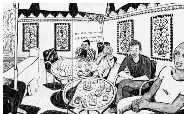
Résidence à Meknès