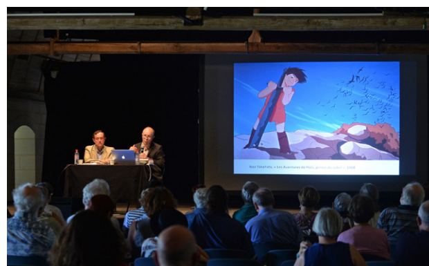
Conférence à Fontevraud : la légende arthurienne au cinéma