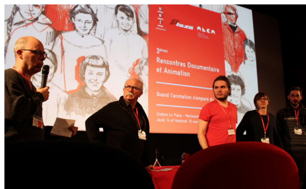
Projection de films d'étudiants de l'EMCA - Rencontres 2019