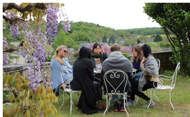
Résidents à Fontevraud, avril 2019