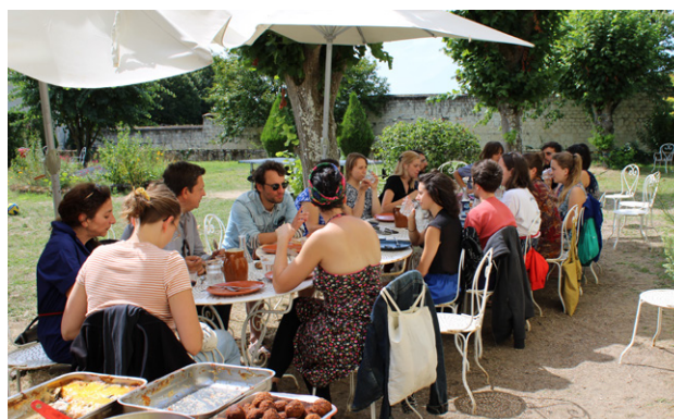
Les réalisateurs en résidence à Fontevraud, août 2019