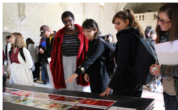
Présentation des résidents pendant la rencontre, octobre 2019