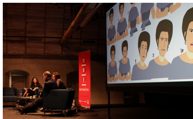
Etude de cas autour du film Calamity de Rémi Chayé