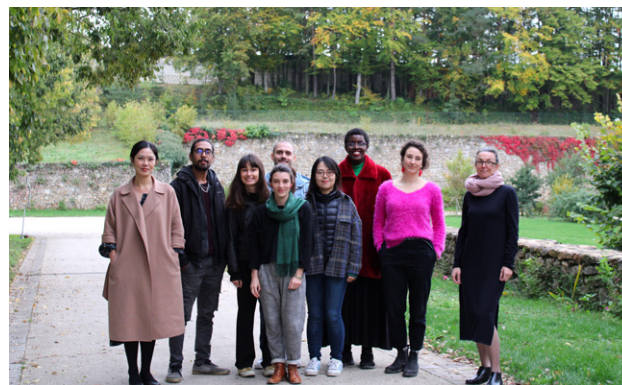
Résidence à Fontevraud, octobre 2019