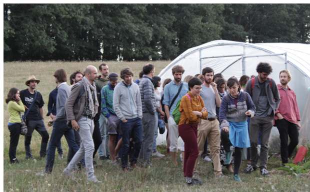
Visite du Domaine de Land Rohan - Atelier Eco Animation