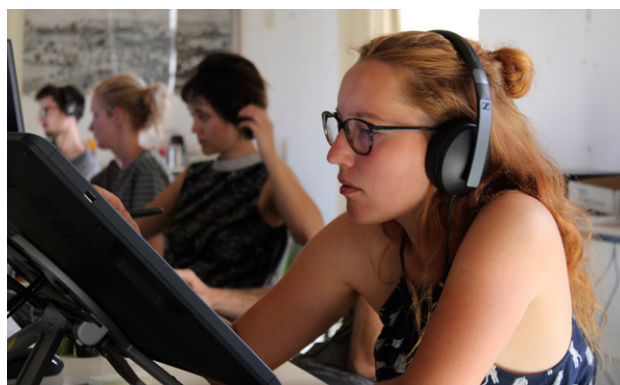
Les réalisateurs en résidence à Fontevraud, août 2019

Les films finalisés seront diffusés en mars 2020 pour le Printemps des Poètes sur France 3 (case LUDO).