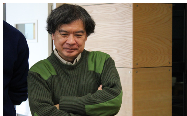
Grand Atelier Sunao Katabuchi en Alsace - 2019

Le Grand Atelier a fait l'objet d'une captation vidéo et sonore intégrale pour archives.