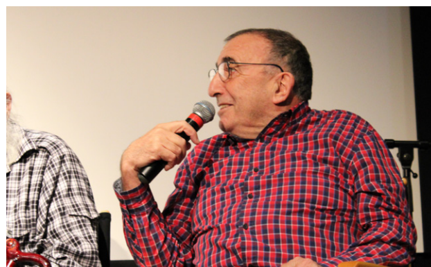
Journée d'étude Jacques Colombat à la Cinémathèque Française

L'ensemble des échanges ont été enregistrés.