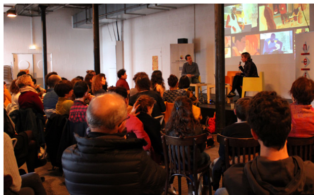
Etude de cas de projets en cours de développement au Lieu Unique