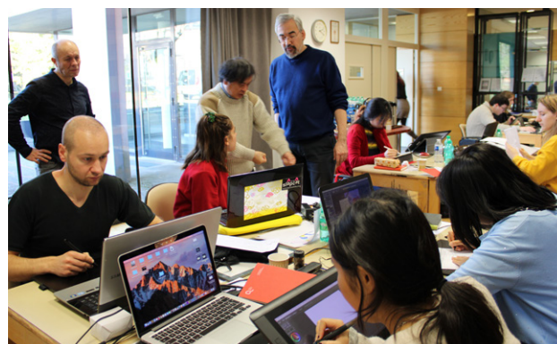
Grand Atelier Sunao Katabuchi en Alsace - 2019