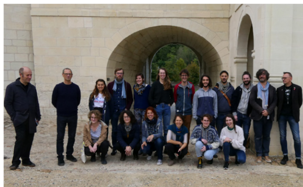
Grand Atelier Patar & Aubier 2019

Vidéo de restitution de l'exercice : à venir