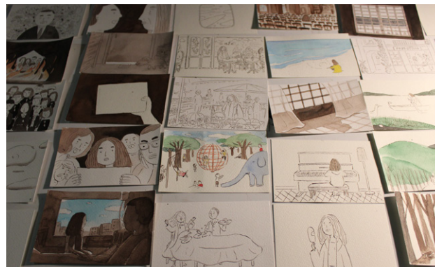
Présentation des recherches graphiques de Charlie Chen, octobre 2019