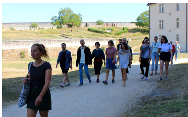
Les réalisateurs en résidence à Fontevraud, août 2019