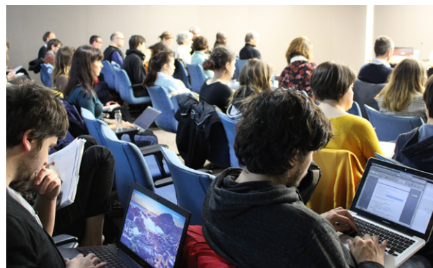
Colloque « La fabrique de l'animation » à Toulouse