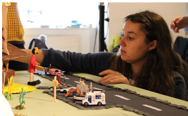
Grand Atelier Patar & Aubier 2019