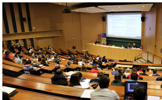
Conférence de Sunao Katabuchi à l'Université de Strasbourg - 2019