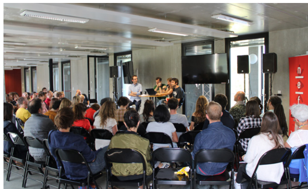
Atelier Eco Animation 2019