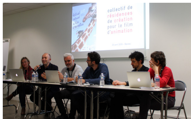
Présentation du collectif de résidences à Rennes