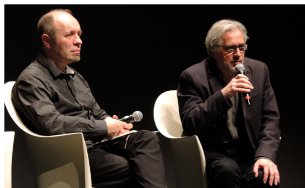
Leçon de cinéma de Michael Dudok de Wit - Premiers Plans 2019

La NEF Animation a également présenté aux festivaliers, le 31 janvier, une sélection de courts-métrages écrits en résidence.