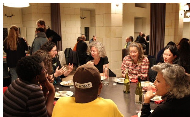
Déjeuner et échanges pendant la rencontre professionnelle 2019