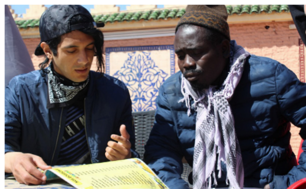
Résidence à Meknès - terrasse d'un café