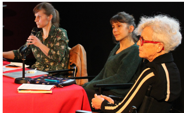
Etude de cas autour des Petites Madeleines - Rencontres 2019