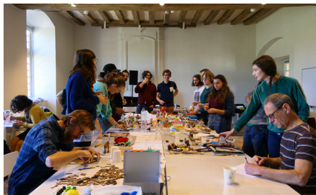
Grand Atelier Patar & Aubier 2019