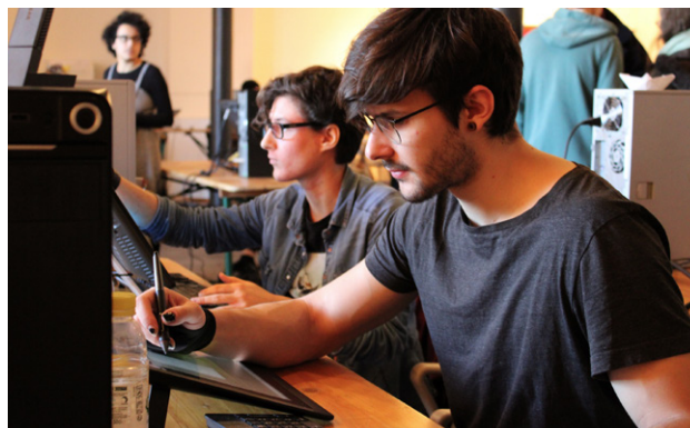
Marathon animé avec les étudiants de l'Ecole Pivaut