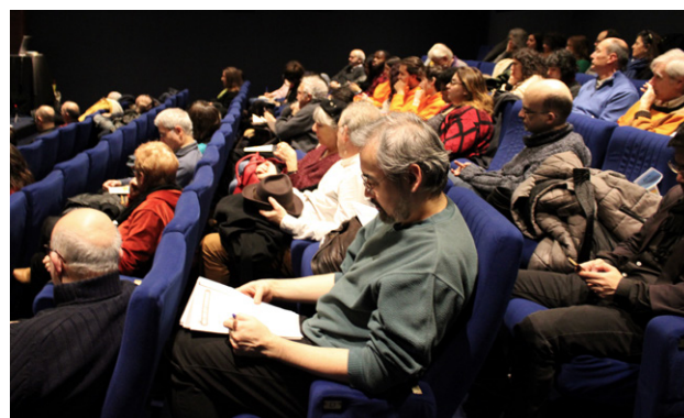
Journée d'étude Jacques Colombat à la Cinémathèque Française