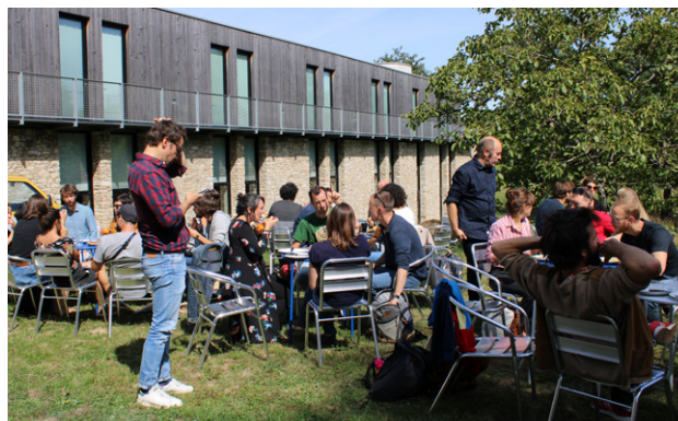
Atelier Eco Animation 2019