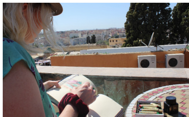
Résidence à Meknès - terrasse d'un café