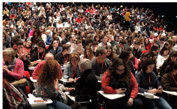
Leçon de cinéma de Michael Dudok de Wit - Premiers Plans 2019