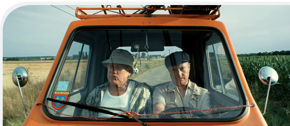
Les petits Ruisseaux de Pascal Rabaté - Loin derrière l'Oural