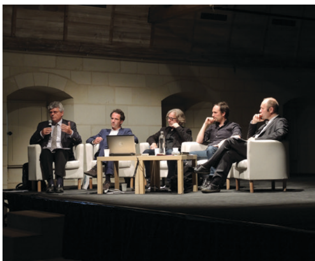
Rencontre professionnelle, Fontevraud, 2014

Ces rencontres professionnelles permettent également aux résidents de présenter leurs projets et d'établir des liens, notamment avec des producteurs.